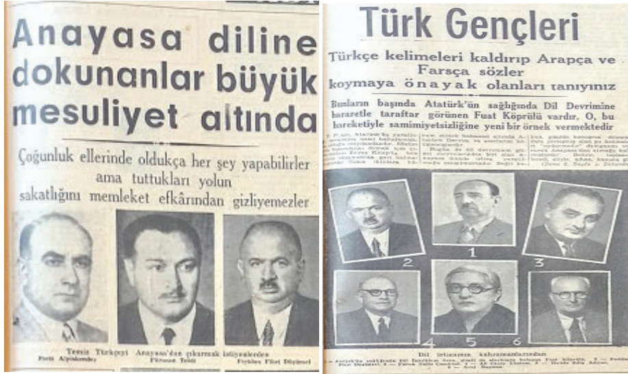
Resim 4: 1952 Anayasa değişikliği sürecinde Ulus gazetesindeki haberler (1952: 1-7)

DP'nin hazırladığı Anayasa değişikliği metninde Teşkilat-ı Esasiye'ye tam sadakat söz konusudur. Bir milletvekilinin kanunun "meriyete konulması" ifadesinin "yürürlüğe konulması" şeklinde değiştirilmesi teklifi dahi Teşkilat-ı Esasiye'de 'yürürlük' kelimesi olmadığı gerekçesiyle reddedilmiştir (TBMM Tutanaklar, 1952: 408). 1952 değişikliğinden yaklaşık iki yıl sonra TBMM İçtüzüğü, TBMM Dâhili Nizamnamesi adıyla değişecek, 2 Mayıs 1927 tarihli İçtüzük kabul edilecektir (TBMM Tutanaklar, 1954).