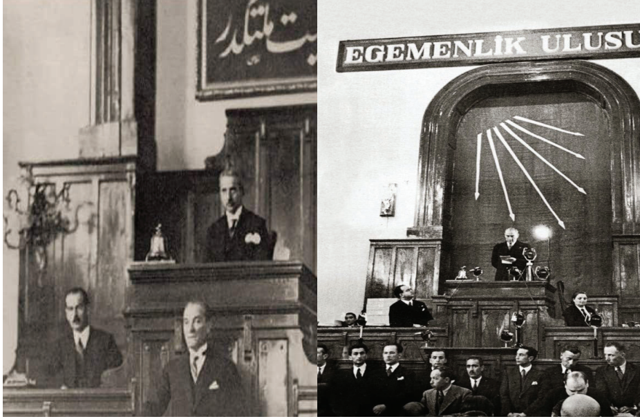
Resim 2: TBMM Genel Kurul Salonu'nda 1927'de "hâkimiyet milletindir" ve 1935'te "egemenlik ulusundur" levhasının yer aldığı fotoğraflar 2

Dolayısıyla 1924 Anayasası'nın üçüncü maddesi olan "Hâkimiyet bilâkaydüşart milletindir" ifadesinin altı ay sonra değışecek Anayasa'da nasıl yer alacağına o günlerde karar verilmediğı görölmektedir. Görüşmelerde bir milletvekili de Teşkilat-ı Esasiye değışikliği çalışmalarının başladığını, ancak henüz "proje halinde" olduğunu söylemiştir. İtirazlar üzerine Komisyon'a iade edilen tasarinın bir ay sonraki görüşmelerinde "hâkimiyet milletindir" sözünün "yeni devletin temelini ve ruhunu yansıtan kutsal prensibin ifadesi" olduğu belirtilmiş ve tasarı bu şekilde kanunlaşmıştır (TBMM Tutanaklar, 1944).