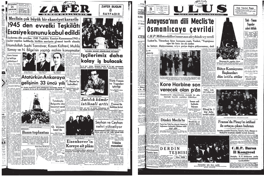
Resim 5: 1952 Anayasa değişikliğinin DP'nin yayın organı Zafer ve CHP'nin yayın organı Ulus gazetelerinde yer alan haberleri (1952: 1)