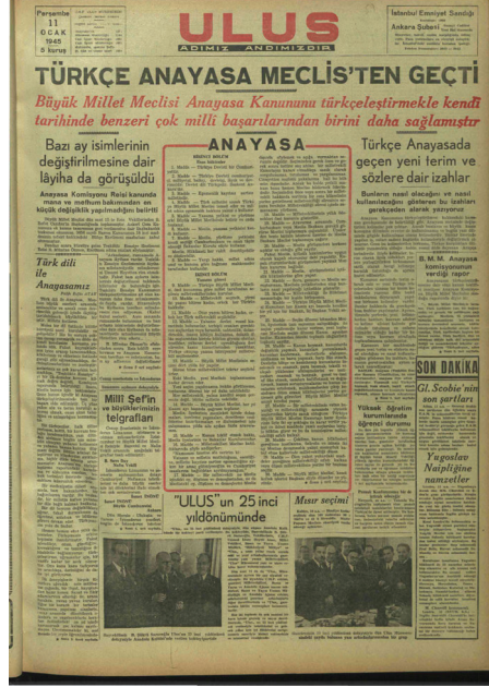
Resim 3: 1945 Anayasa değişikliğine ilişkin Ulus gazetesinde yayımlanan haber (1945:1)