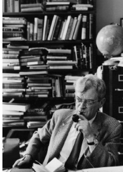
Prof. Dr. Alexander Gerschenkron.

devrimi üstüne bir çalışması yayınlanan sosyolog Thorstein Veblen'den sonra (Veblen, 1915), tarihçiler sanayileşen diğer ülkelerin/ulusların İngiliz modelini mi izlediklerini, yoksa ondan ayrıldıklarını mı?, gecikenlerin (late-comer) kendilerinden öncekilere oranla birtakım üstünlüklerden yararlanıp yararlanmadıkları gibi konularda odaklaşmışlardır. Bu alandaki önemli isimlerden biri de Rus asıllı Amerikalı iktisat tarihçisi ve kalkınma iktisatçısı Prof. Dr. Alexander GERSCHENKRON'dur.