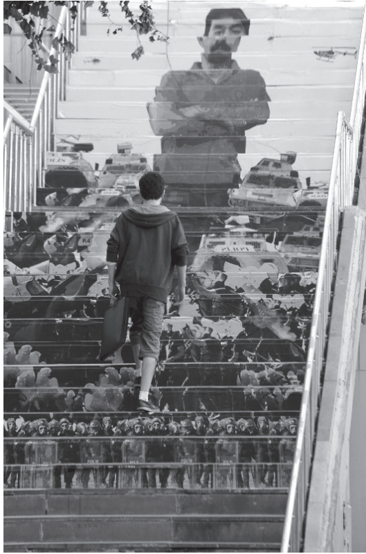
“Ethem Sarısülük”, Kabahatler Atölyesi (2013)

Grubun bu merdivenleri seçmekteki amacı yaşam alanları içinde kendilerini ifade etmek için dikkat çekici ve uygun bir alan olmasıydı. Merdivenler ikinci kez Ethem Sarısülük'ün vurulmasının ardından onun resmini sergilemek için kullanıldı.