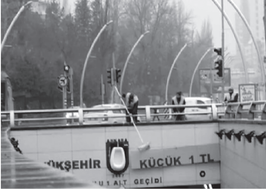
"Büyükşehir Küçük 1 TL", KÜF Project (Mayıs 2011)

Kabahatler Atölyesi'nin Konur Sokak'ı, Avareler'in Eskişehir Yolu'nu mesken tutmaları gibi, KÜF de çoğunlukla Tunalı Hilmi Caddesi civarında çalışır. Bunun bir nedeni, kimi işlerinin "mekâna özgü" ( site-specific ) olmasıdır: Örneğin "Büyükşehir Küçük 1 TL" (Mayıs 2011) işinde hedef, banyo seramiği benzeri bir renk ve materyalle döşenen ve üzerlerine kitsch kuğu figürleri çizilen Kuğulu Alt Geçidi'nin kentsel estetikten yoksunluğuyla dalga geçmektir; "Tosun Paşa" (Nisan 2010), Kuğulu Park kavşağındaki "Gaziosmanpaşa" tabelasının değiştirilmesine dayalı bir iştir. Bir başka neden ise, tıpkı Kabahatler Atölyesi'nde gördüğümüz gibi bu çevrenin ekibin gündelik yaşam alanı olmasıyla ilgilidir: "O sokaklarda yanan ampulleri yine o sokaklarda dışa vuruyoruz". KÜF, kenti değiştirip, dönüştürmeye öncelikli kendi çevresinden başlar, değişim ve eyleme geçme çağrısını önce burada seslendirir.