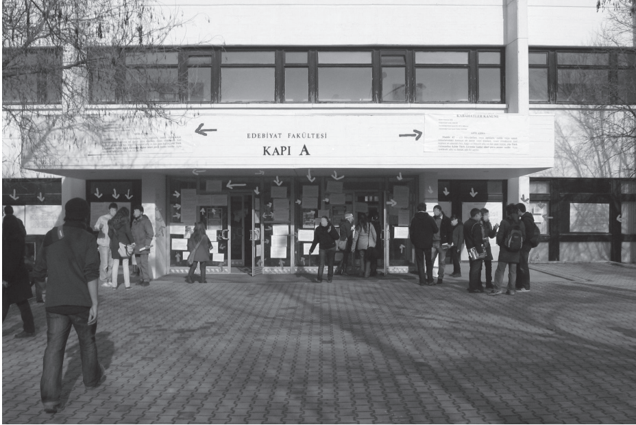
“Afiş Asmak Yasaktır”, Kabahatler Atölyesi (2008)

Beştepe’de afiş asmak yasaklandı ve rektör bu yasağı Kabahatler Kanunu’ndan kopyalayıp yapıştırdığı ilgili maddeyi koyarak, altında imzasının olduğu bir afişle duyurdu. Yani “afiş asmak yasaktır”ın bir afişi vardı. İronikti. O zamanki arkadaşlarımla bu afişin bir tane kopyasını aldık ve çok fazla sayıda çoğalttık; büyüttük tekrar çoğalttık, küçülttük çoğalttık ve Edebiyat Fakültesi'nin giriş camlarını, içerisini ve panolarını bu afişle doldurduk... Güvenlikçiler geliyor, bakıyor, yapacak bir şey de yok çünkü rektörlüğün imzası var altında, “şu zamanlar arasında asılabilir bu afiş” diye. Dekan da geldi, yapacak bir şey yok. Biz de orada gülüyoruz.