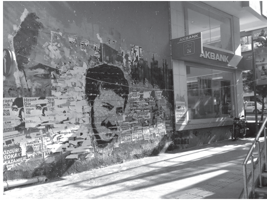
Kabahatler Atölyesi ve Öğrenci Kolektifleri (2013)

Merdivenlerin -Kabahatler Atölyesi'nin kullanımı dışında- yeni bir işlev kazanarak sergileme yüzeyine dönüşmesinin örneği, Öğrenci Kolektifleri'nin Ali İsmail Korkmaz davasına destek için yaptıkları çağrıyla merdivenlere yerleştirmeleri olmuştur. Kolektif, dev posterleri basamaklara parça parça yapıştırırken altta Atölye'nin o güne dek dokunulmadan kalan yelkenli resmi yavaş yavaş yerini Ali İsmail portresine bırakmış, sokaktan gelip geçenler sokak sanatının bu yaratıcı yıkımının ilk sahnesine tanık olmuştur. 11 Ertesi gün, ikinci sahnede, bu kez Kabahatler Atölyesi biraz acemice yapıştırıldığı için dökülüp saçılmaya başlayan parçaları toplayıp, yandaki duvarda kendilerinin yapmış olduğu Ethem Sarısülük resminden geriye kalanların hemen yamacına taşımış, Ali İsmail'in yüzü Kabahatler Atölyesi'nin üst üste yaptığı işlerin ve onlarca politik afişin yapıştırıldığı bu palimpsestin bir parçasına dönüşmüştür: "Ethem'in gözleri öyle uzun süre kaldı. Sürekli kopardılar, yırttılar ama orası biraz yüksekte kalıyordu. Yapıştırılanların altında öylece durdu kaldı bir süre."