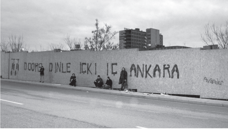
“Doors Dinle İçki İç Ankara”, Avareler (2010)

Tanışıklıkları okul yıllarına dayanan Avareler, aynı fakültede güzel sanatlar eğitimi görmüş beş kişilik bir ekip. İlk çalışmaları Eskişehir yolundaki bir alışveriş merkezi inşaatının paravanına yazdıkları 14 metrelik “Doors Dinle İçki İç Ankara” (2010) duvar yazısı. Bu yazıyla birlikte, artık geleneksel sanatın sınırlarına sığmayacaklarını anlayan grup elemanları sokak sanatı çalışmalarını sürdürmeye karar veriyorlar. Kolektifin ismi aynı eve çıkmadan önce geçirdikleri, camilerde, otobüs terminalinde ya da okuldaki atölyede sabahladıkları avarelik yıllarına bir gönderme; ne var ki bunun, geceleri çıkıp şehrin sağına soluna kendilerinden izler, mesajlar bırakan bir grubun yaptığı işin ruhunu yansıtan bir isim olduğu da söylenebilir.