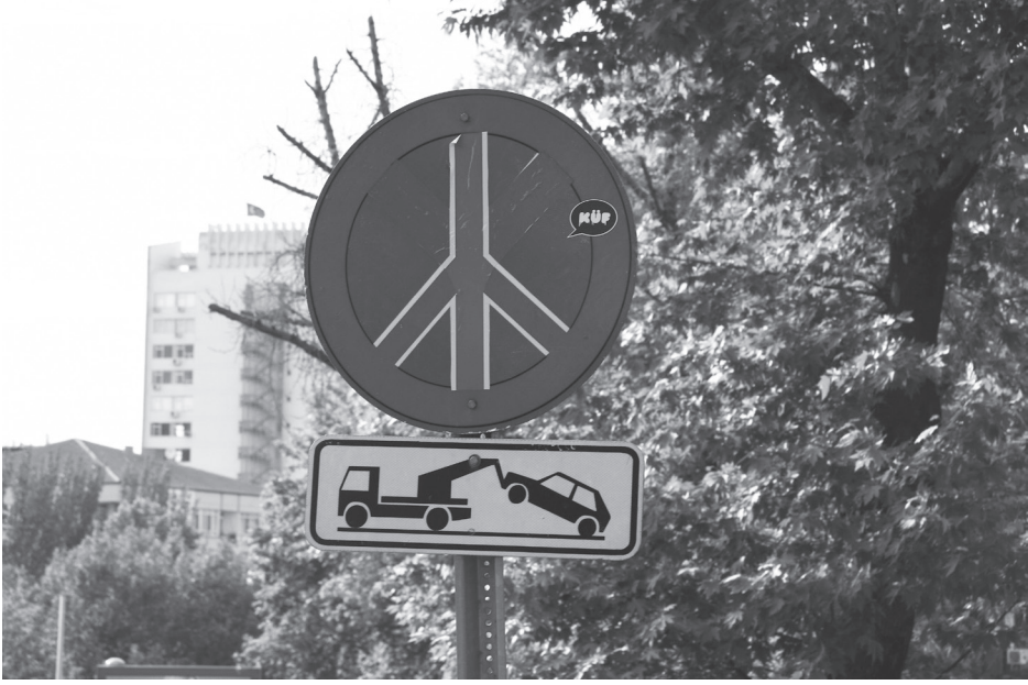
"Peace", KÜF Project (2010)

Tunalı Hilmi Caddesi'ndeki "duraklama yapılamaz" tabelalarına birer sticker yapıştırıp bunları "barış işareti"ne dönüştürerek Mavi Marmara baskını ve aynı gün İskenderun'da gerçekleşen bombalı eylemi kınamışlar, birkaç gün sonra, Türkiye milli takımının Dünya Kupası'na katılamamasından duydukları hayal kırıklığı üzerine, "It's the Football" (2010) adını verdikleri işlerinde, aynı caddeyi bir uçtan diğerine kuşatan tabelalara forma numaraları vermişlerdir.