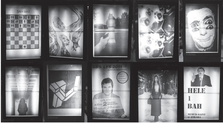
“40 Haramiler”, Avareler (2012)

hava reklam şirketlerinin (Ströer-Kentvizyon) panoları (raket CLP) ve otobüs duraklarına (CLP durak) yerleştirilmek için tasarlanmıştır.