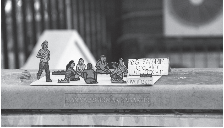
"Eski Oyunlar Serisi", Avareler (2013)

Bu iş şöyle aklımıza geldi: Marketten dönerken iki çocuk çimlerde oturuyordu, yanlarında top da vardı ama ikisi de ipad 'de futbol oyunu oynuyordu. Çocuklar artık AVM'lerdeler, oradaki kapalı alanlarda oyun oynadıkları için sokağa çıktıklarında da aynı dar sınırlarda kalıyorlar. Orada bir ekran ve kendisi var. Sokakta oynarken öyle değil; mızıkçılığı öğreniyorsun, paylaşımcılığı öğreniyorsun, kavgayı, edebi öğreniyorsun. Dayak yiyorsun, atıyorsun. Ama şimdi birisinin "yazdığı", sınırlarını birisinin çizdiği bir şeyin içindesin, "biz" in ölüp "ben" in doğduğu yerler bu dokunmatik ekranlarımız.