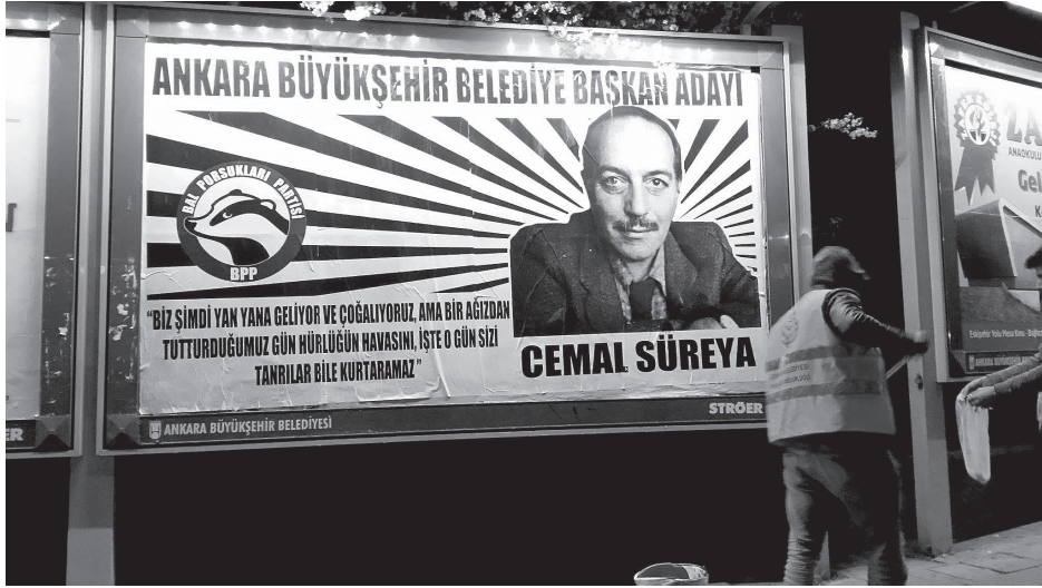
“Bal Porsuğu Partisi”, Avareler (2014)

gibi yol kenarlarındaki ayaklı billboardları da kullanarak 2014 yerel seçimine giren partilerin karşısına “Bal Porsuğu Partisi”nin adaylarını çıkarmışlardır. Ankara’daki hâkim belediyecilik anlayışıyla dalga geçen ve seçmenleri neye oy verdikleri konusunda düşünmeye iten aday tanıtımları, Çukurambar, Sıhhiye, Ümitköy, Çayyolu, Emek, Bahçeli ve Balgat’ı kapsayan geniş bir kentsel alanda sergilenmiştir.