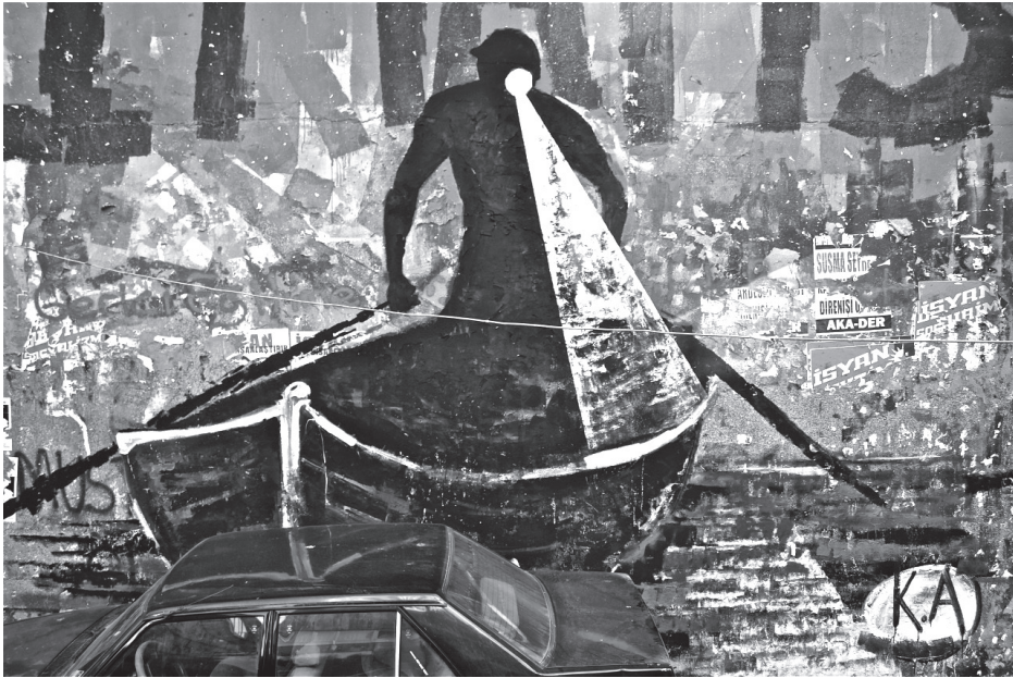
"1 Mayıs", Kabahatler Atölyesi (2014)

Kabahatler Atölyesi'nden önce de kullanılan bu duvarı, direnişin ve kolektif hafızanın kamusal bir mecrası olarak ele alabiliriz. Bugün de duvar sadece Kabahatler Atölyesi'nin değil sokak sanatıyla ilgili olsun olmasın toplumsal muhalefeti temsil eden her türlü grubun afişleriyle, sloganlarıyla doludur. Bu anlamda bu duvarı "toplumsal muhalefet duvarı" olarak adlandırmamız yanlış olmayacaktır. Şu günlerde duvar, yavaş yavaş soluklaşan ve üstü kapanmaya başlayan, geçen 1 Mayıs'ta (2014) Kabahatler Atölyesi'nin yaptığı, karanlık suları ışığıyla aydınlatarak kürek çeken bir madenci resmiyle kaplı. Merdivenlerdeyse en son, Dünya Emekçi Kadınlar Günü'nde kadınlara armağan olarak yaptıklarını söyledikleri dev bir karanfil resmi vardı.