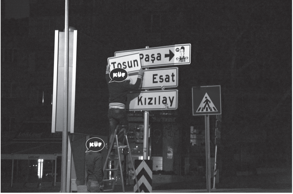
“Tosun Paşa”, KÜF Project (Nisan 2010)

“Büyükşehir Küçük 1 TL”, “Pisuvar” adıyla da bilinen bir iştir: KÜF, bu “ready-made” (hazıryapım) işte, geçidin girişine yerleştirdiği pisuvarla, yukarıda söz ettiğimiz altgeçidin devasa bir umumi tuvalete olan benzerliğine dikkat çekmiştir. 13 Dahası bu işin videosuyla birlikte dolaşıma giren metinle, Gökçek belediyeciliğinin alamet-i farikası olan pek çok başka unsuru da hedef almıştır: